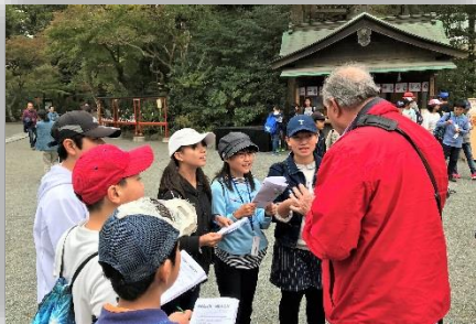
外国人の方との交流

これまでの学習の成果を生かして、修学旅行に行ってきました。1日目は、鎌倉班別学習。班ごとに建長寺を出発し、鶴岡八幡宮、小町通り、江ノ島電鉄を利用して、長谷寺、そして鎌倉大仏のある高德院です。子どもたちは互いに助け合い、歴史と文化を学びながら、外国人の方との交流にもチャレンジして、無事ゴールすることができました。横浜のホテルに宿泊し、2日目は江戸東京博物館と国会議事堂の見学を行いました。