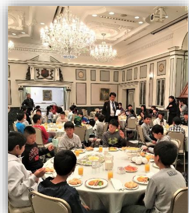
ホテルでの豪華な朝食