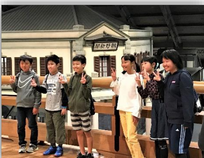
江戸東京博物館での見学・体験