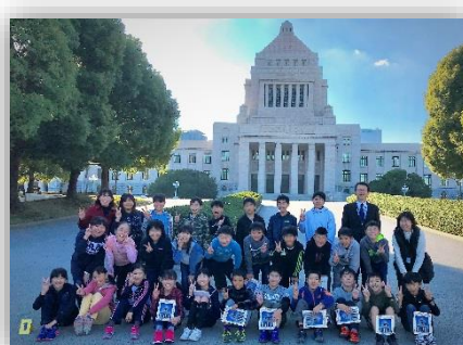
国会議事堂 (参議院) 見学