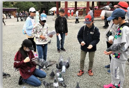
鶴岡八幡宮 ハトとの交流