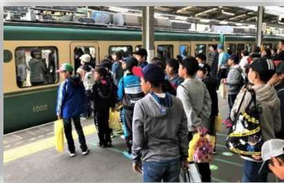
江ノ島電鉄に乗車