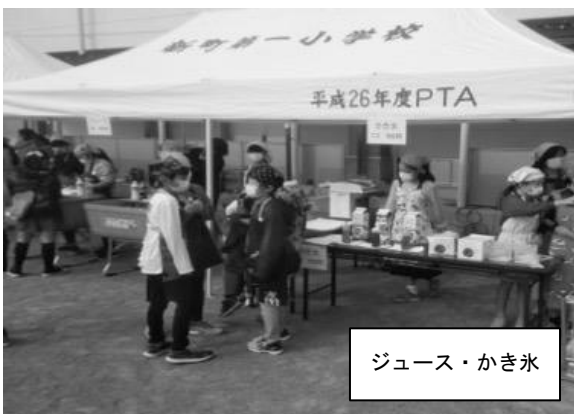
ジュース・かき氷